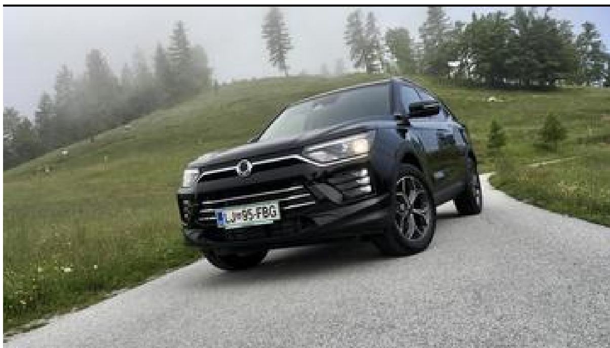
Končno privlačni korejec, ki se cenovno prikloni kupcu